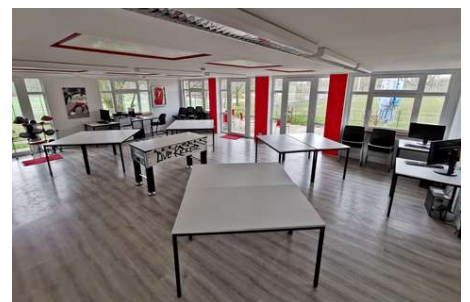
Der „Lernort Seumannstraße“ der Essener Chancen bleibt bis auf Weiteres geschlossen.