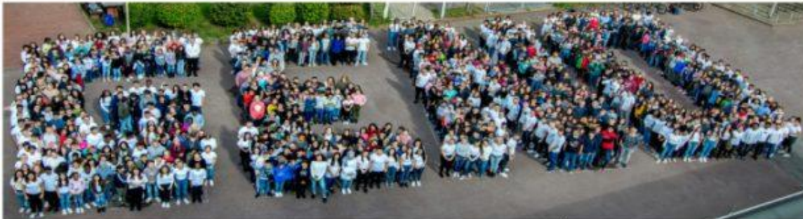
Ganztagsgymnasium seit 1991- Vorstellung der Erprobungsstufe im Übergang von der Grundschule